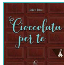
ISBN 978-88-67450-14-5 Cioccolata per te