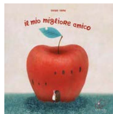
ISBN 978-88-95799-70-4 Il mio migliore amico