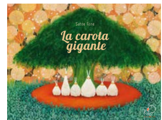
ISBN 978-88-67450-039 La carota gigante