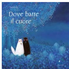
ISBN 978-88-95799-96-4 Dove batte il cuore